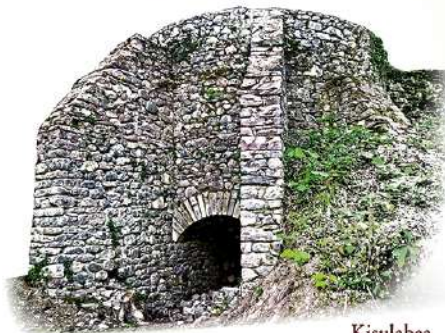
Kisulabea Horno de cal Four à chaux

A Irurita aujourd'hui, il est encore possible de trouver des éléments qui rappellent les métiers d'antan. Des exemples en sont les moulins, les fours à chaux et une petite forge qui servait jusqu'à récemment à réparer le bétail.